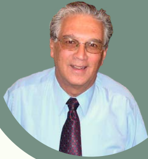
Fernando Álvarez de Torrijos